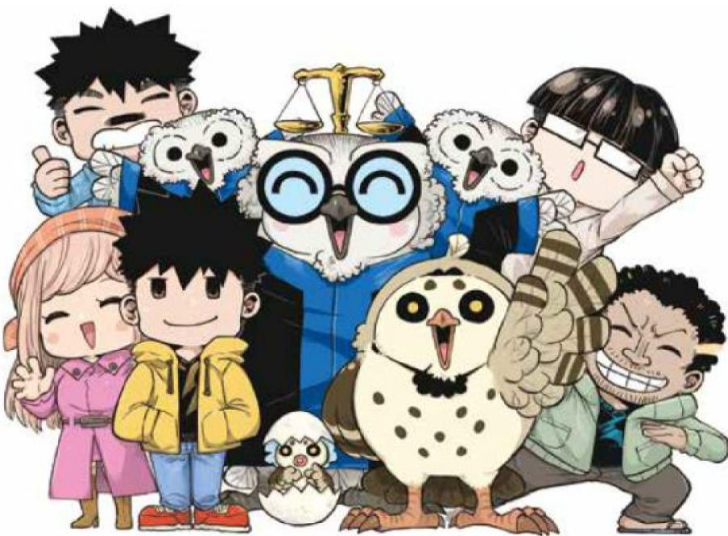
圖案引自司法院官網